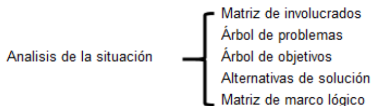
Figura 2: análisis de la situación

Los pasos lógicos para la elaboración del proyecto bajo la MML comprenden el siguiente análisis de la situación.