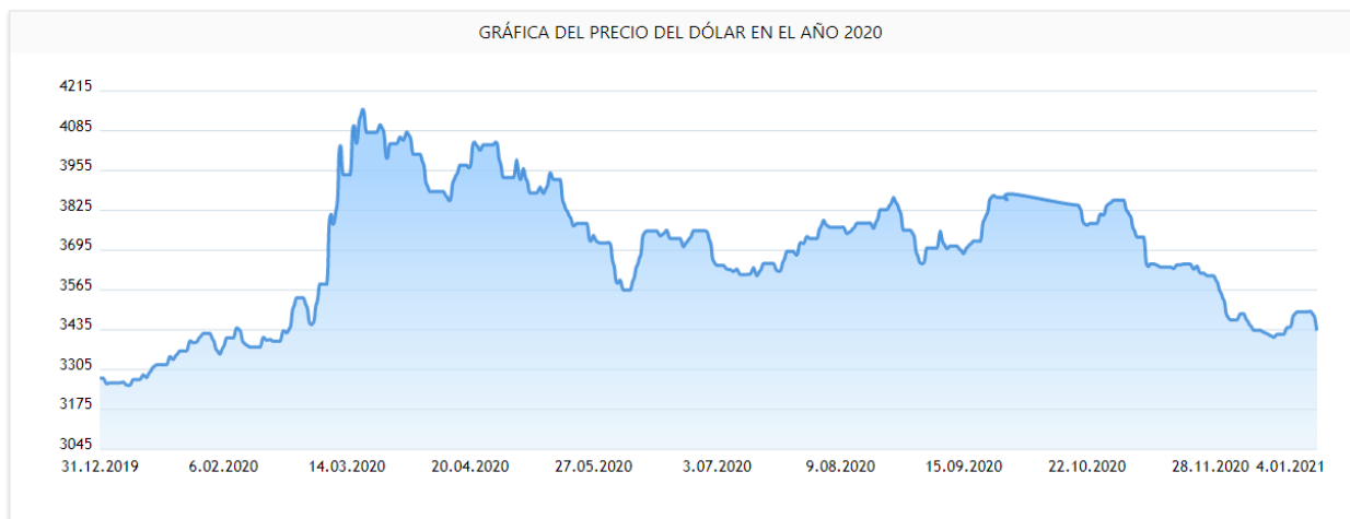
Figura 6: Grafica precio del dólar año 2020.