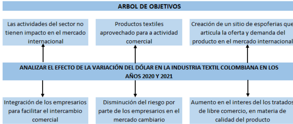
Figura 5. Árbol de objetivos