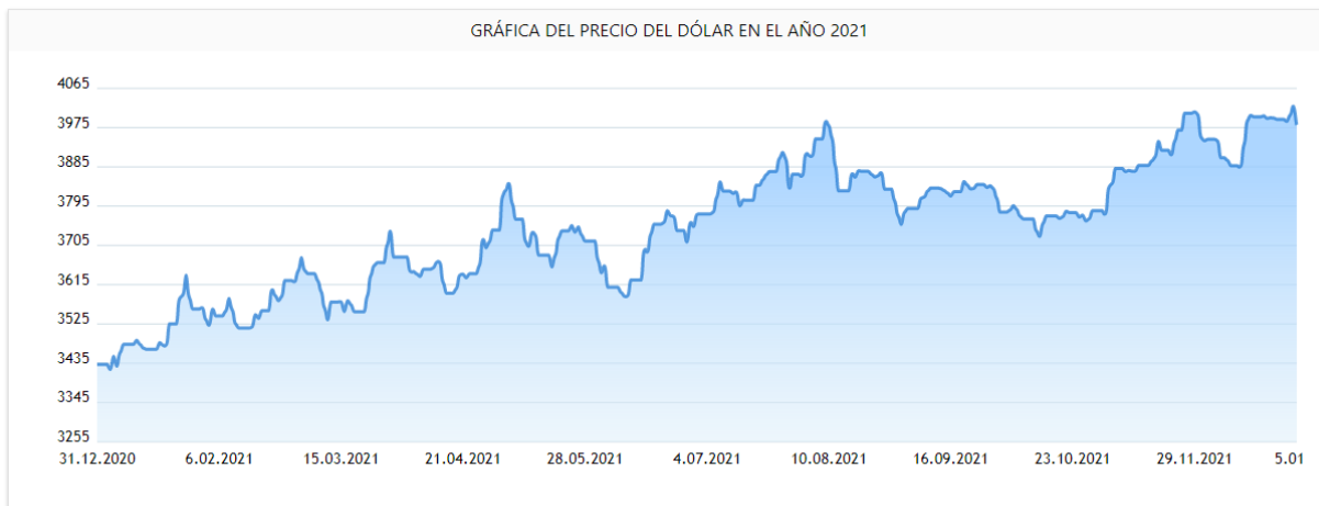
Figura 7: Grafica precio del dólar año 2021.