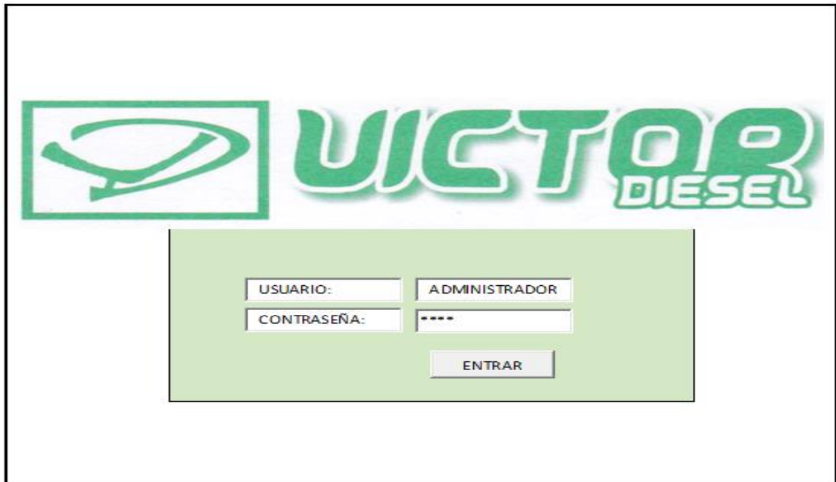
Figura 2: inicio de sesión