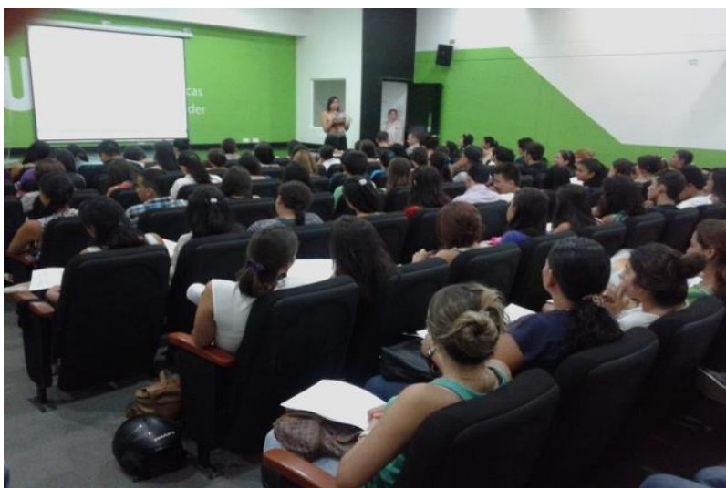
Conferencia del Banco de la República en el Auditorio Sala Virtual UTS, II-2016