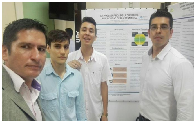
Registro fotográfico encuentro de Semilleros de Investigación UDI. II-2016