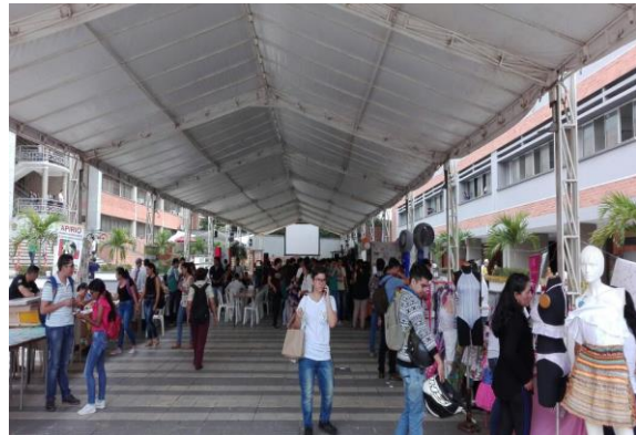
Registro fotográfico de actividades de actividades de estudiantes de Banca con otros Programas año 2017

Adicionalmente, se tiene desarrollado un proyecto interdisciplinario referente a un plan de negocios en una empresa de calzado.