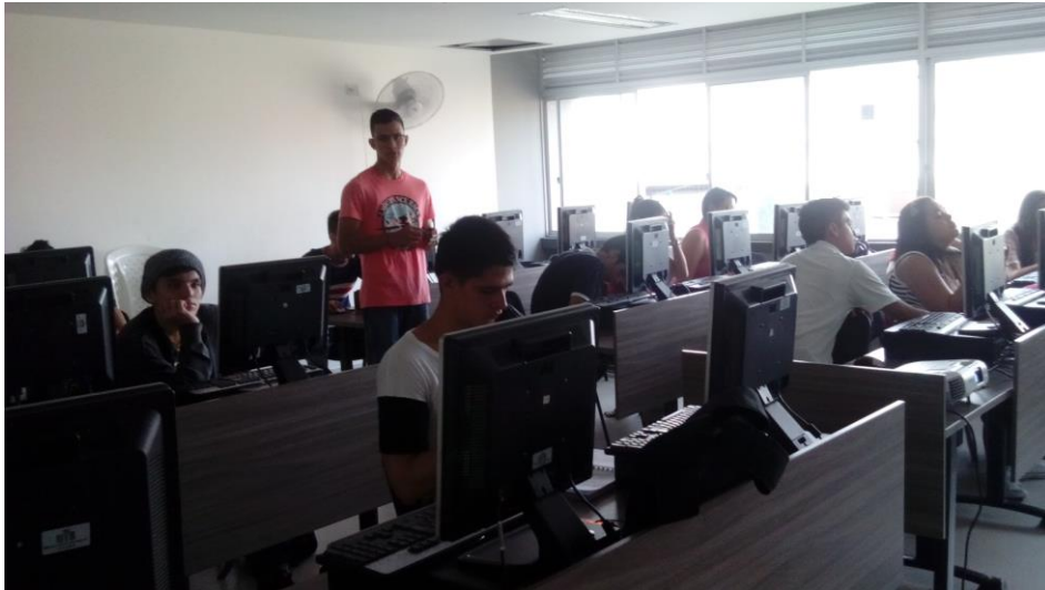
Registro fotográfico del Reto financiero. I-2017