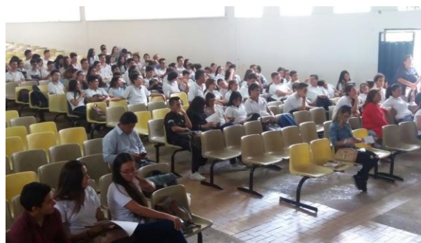
Capacitación sobre educación financiera en el colegio Politécnico de Bucaramanga año 2017.