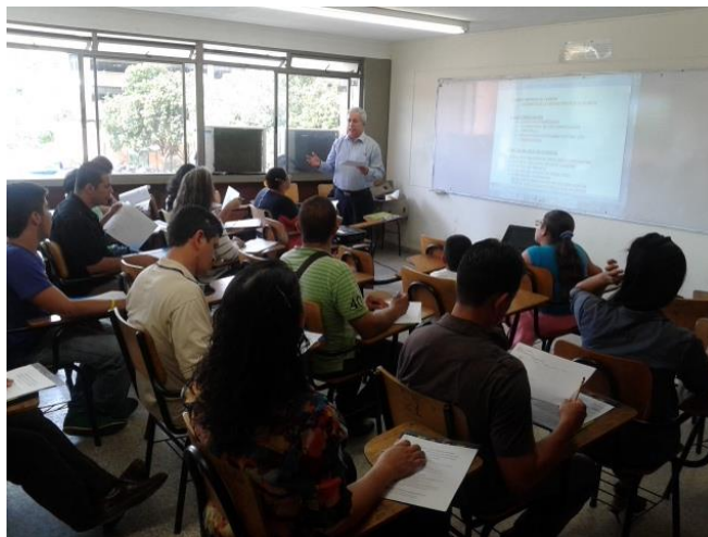
Invitación a los estudiantes a realizar la evaluación docente

Desde el año 2016, se están haciendo campañas tendientes a invitar a todos los estudiantes a que realicen la evaluación docente. Desde la Coordinación se establecen horarios flexibles, se adjudican salas de cómputo, se hace acompañamiento docente guiando a los estudiantes hasta las salas de cómputo y en los salones de clase se concientiza a los estudiantes sobre la importancia de evaluar para mejorar la calidad académica.