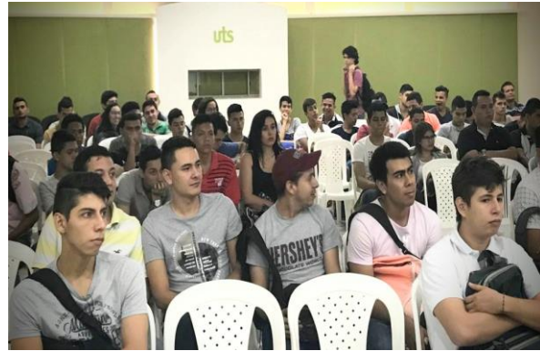
Registro fotográfico conferencia Alianza Francesa