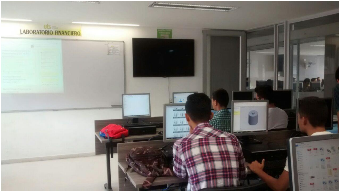
Registro fotográfico del Laboratorio Financiero