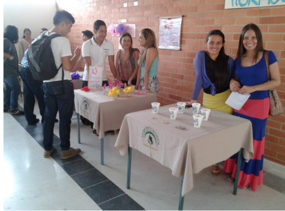
Registro fotográfico de actividades de actividades de estudiantes de Banca con otros Programas año 2016