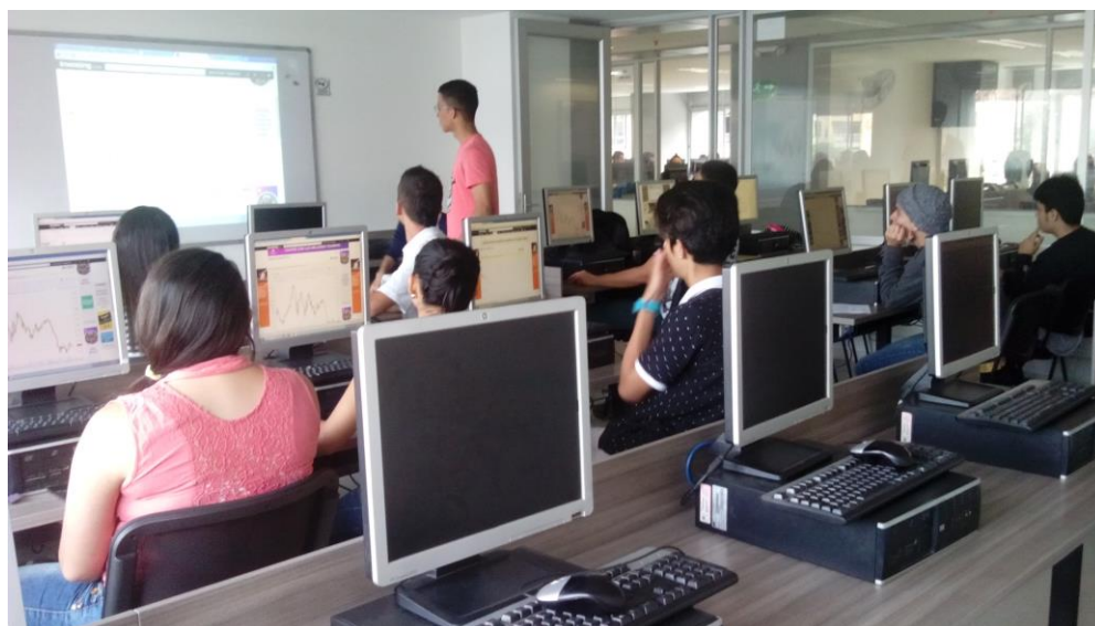
Estudiantes en actividades del Semillero de Investigación. I-2017