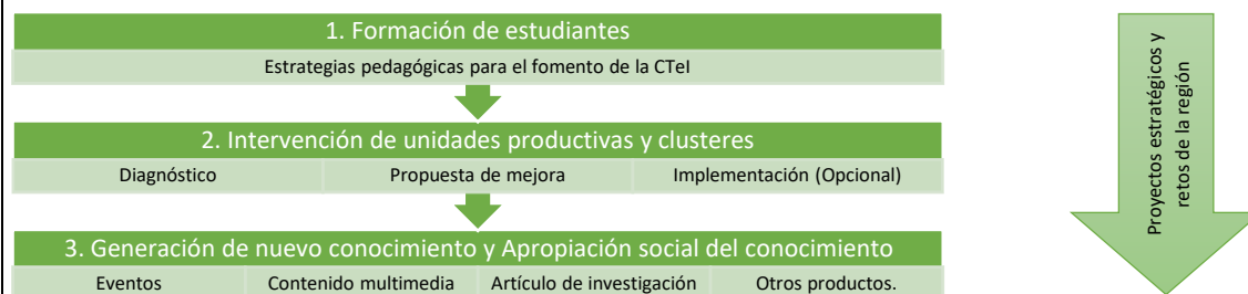
Figura 1. Metodología

El esquema general de la metodología es el que se presenta en la siguiente figura: