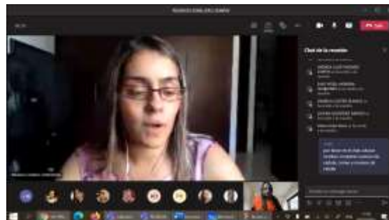
Imágen No 1 Pirmera reunion SEMINV 2021 (I) y Whasapp equipo SEMINV con miembros del semillero.