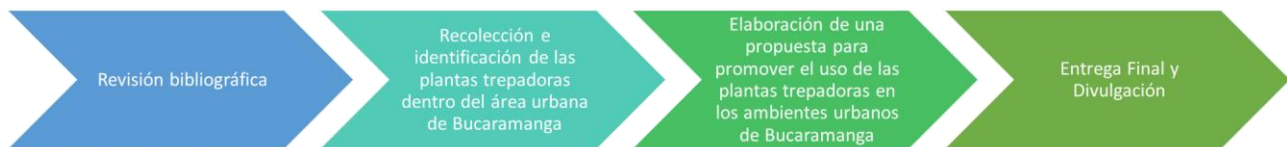
Figura 1. Proceso metodológico.

A continuación del diagnóstico, en la etapa de planeación se elabora una propuesta para establecer el estado de conocimiento y gestión sobre la polinización urbana en Colombia comparada con otros países tropicales, además de alternativas podrían ser implementadas en la ciudad de Bucaramanga para aumentar la biodiversidad de polinizadores Finalmente, en la etapa de socialización y divulgación, se realizará una sistematización, codificación y categorización de la información, la consolidación del trabajo de grado y la socialización de los resultados, conclusiones y recomendaciones a los actores involucrados Ver figura 2.