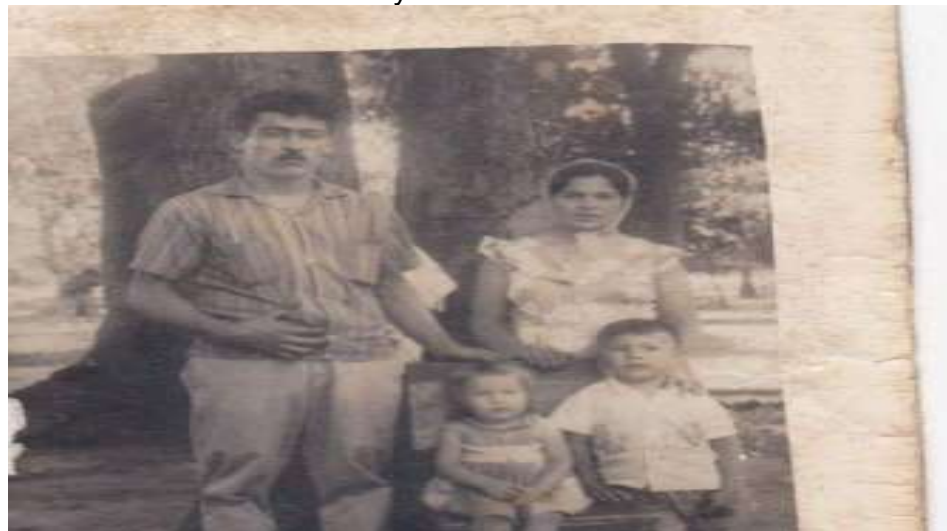
Papas de mi mamá.

Narra recordando su vida con palabras tristes y melancólicas, “llegando a afirmar que no tuvo niñez, pues desde los 5 años ya debía barrer, trabajar, no supo que significaba el cariño y amor de sus padres, no supo lo que fue un juguete y no supo que era ser niña. Y en su adolescencia a los 14 años se fue de la casa por el trato que le daban sus padres, pensó buscar un mejor lugar, pero no fue así, llegando a casarse a las 14 años y medio”.