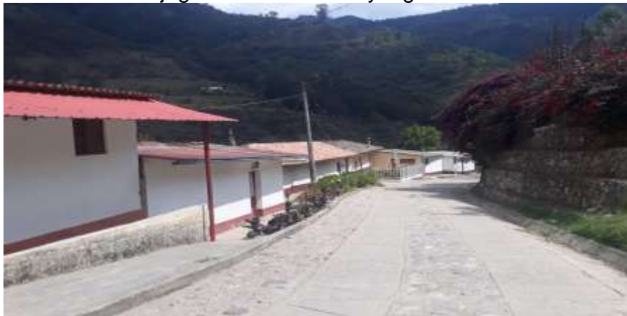
Foto barrio donde jugábamos de niños y lugar donde vive mi abuela.

Que la juventud volviera amugar al bate, a correr a gritar en las calles.