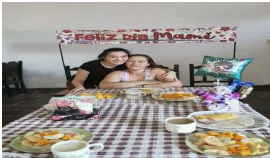
Celebración día de la Madre Cuarentena 2020

“En este tiempo aunque no ha sido fácil, he podido compartir con mis hijos y mis sobrinos, y poder descansar de tanto trabajo, pues en la empresa siempre es complicado, ya por cuestiones de salud, pero siempre feliz, disfrutando de cada cosa entre enojos y alegrías, entre tristezas y gozos, pero en conclusión me he sentido bien”.