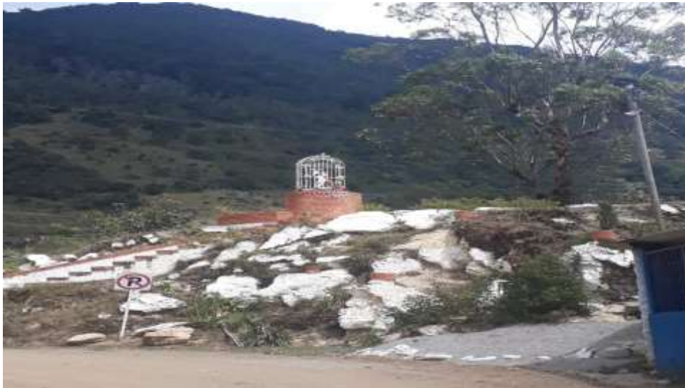
Foto lomita de la venta. Donde mi abuela va a rezar santo rosario. California Santander.