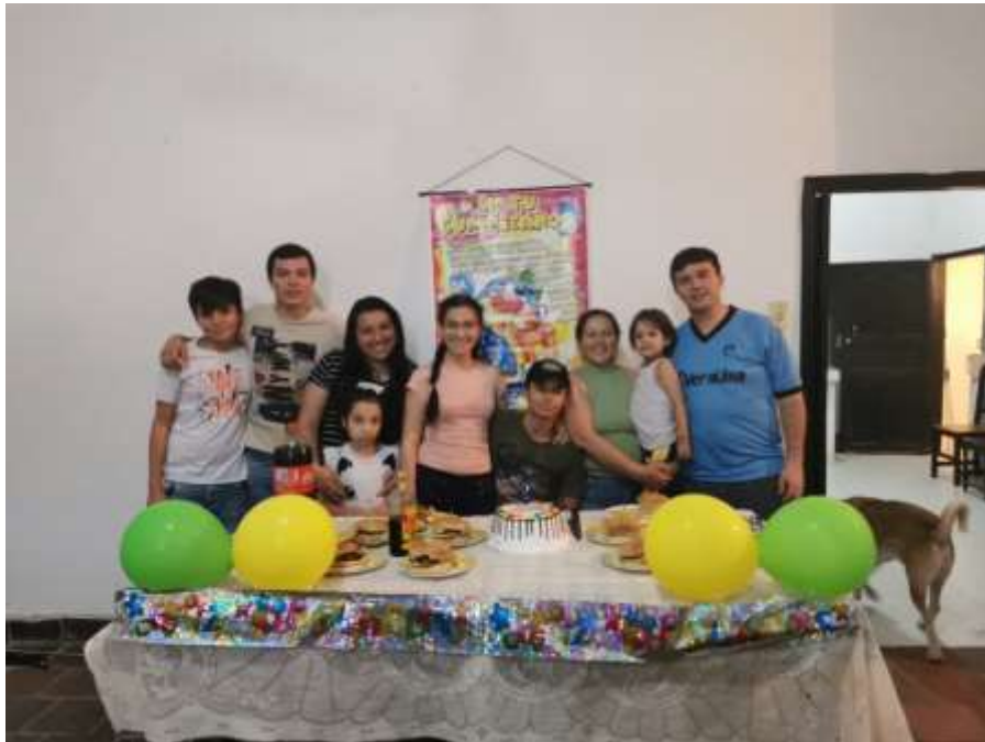
Celebraciones en cuarentena

g) ¿Qué cosas positivas puede resaltar de este aislamiento?