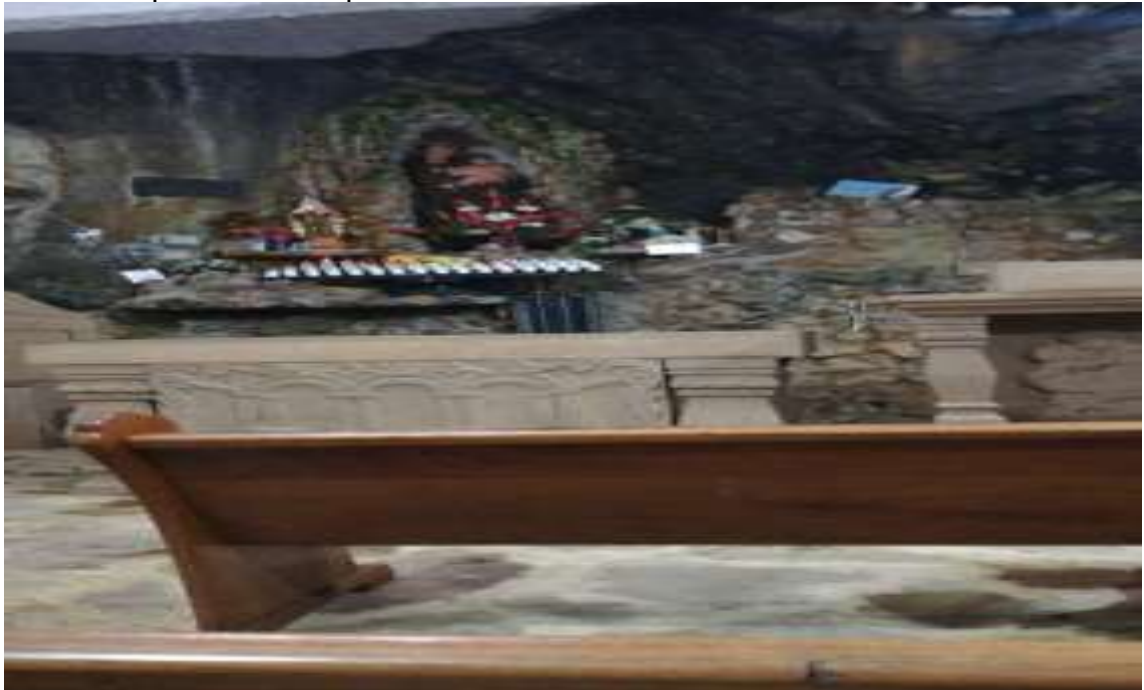
Santuario San Antonio de Padua California

Hacer como un volver a nacer, a la oración al compartir, al descanso, cosas que hacía tiempo se habían perdido.