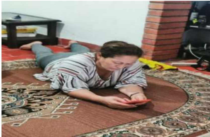
Foto de Mi mamá