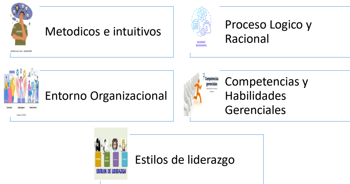
Figura 1 Factores para la toma de decisiones

Para el presente objetivo se realizó la verificación documental sobre los factores que inciden para la toma de decisiones financieras de tal manera que obtengan la buena ejecución de los recursos asignados.