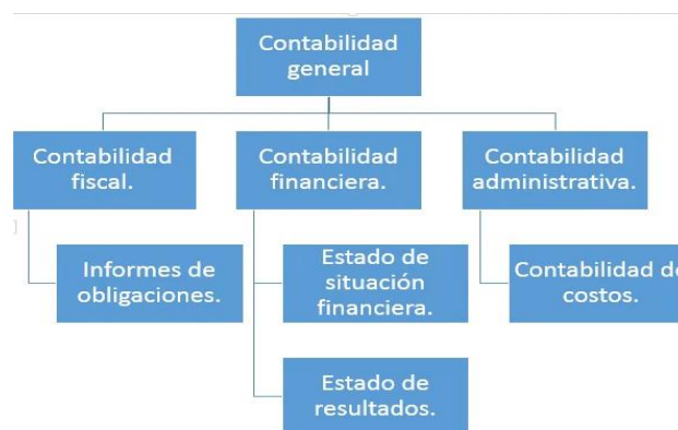
Figura 1. Partes de una buena contabilidad financiera

La contabilidad financiera en Colombia tiene como objetivo principal proporcionar información útil y confiable para la toma de decisiones económicas. Los estados financieros, como el balance general, el estado de resultados y el estado de flujo de efectivo, son elaborados de acuerdo con los principios y normas contables establecidos, brindando una imagen fiel de la situación financiera y los resultados de las entidades (Parra & Olea-Miranda, 2023).