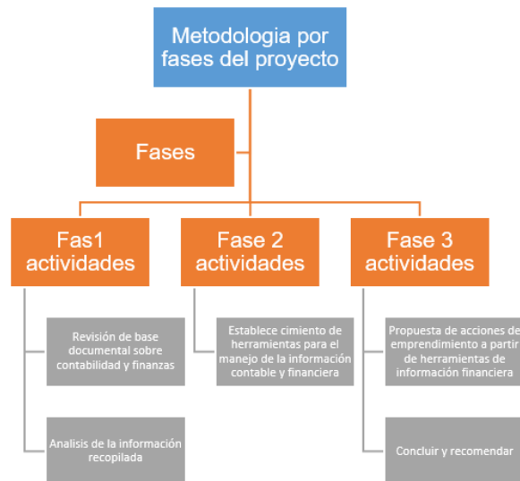
Figura 3. Marco metodológico