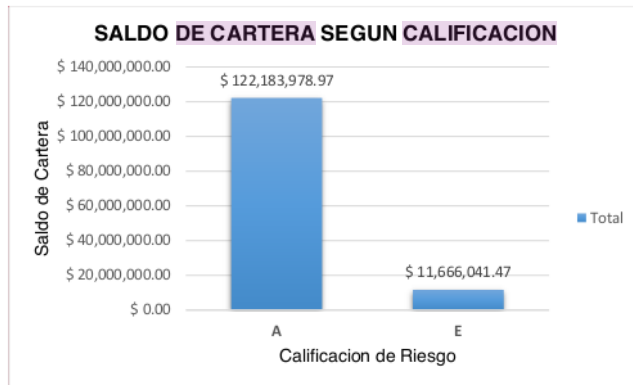
Gráfico 2. Saldos de cartera por calificación de riesgo

Commented [SMRC7]: Mostrar datos en formato de moneda para que sea de fácil lectura.