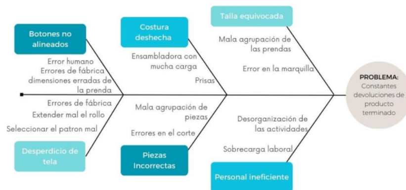
Figura 2. Diagrama Causa-Efecto

Es el caso del diagrama Causa-Efecto que se aplicó para determinar esas principales causas del problema que se presentaba en la organización y que estaba generando devolución de pedidos por parte de los clientes. Ya que, como lo indican en el blog de wow (2022) “El diagrama C-E es una herramienta fundamental que se utiliza en las primeras etapas de un equipo de trabajo para la mejora.” Y, por ende, en esta investigación se aplica para dar paso a las ideas de mejora que se está buscando para la empresa.