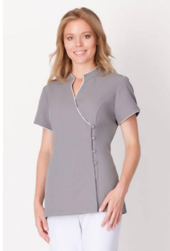
Figura 3. Uniforme Antifluido para droguería