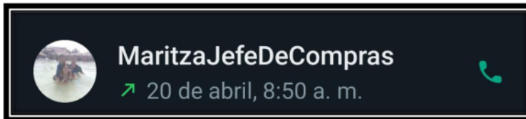
Figura 3. Evidencias de la entrevista

El día anterior se realizó una llamada para recordarle de la cita para la realización de la entrevista.