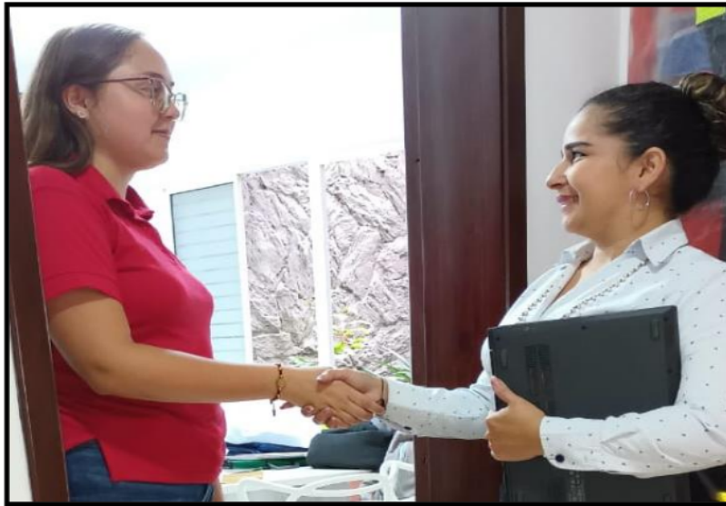
Figura 6 . Evidencias de la entrevista

5.1.5. Se tuvo en cuenta los límites de tiempo para el desarrollo de la actividad según el espacio dado por la persona entrevistada.