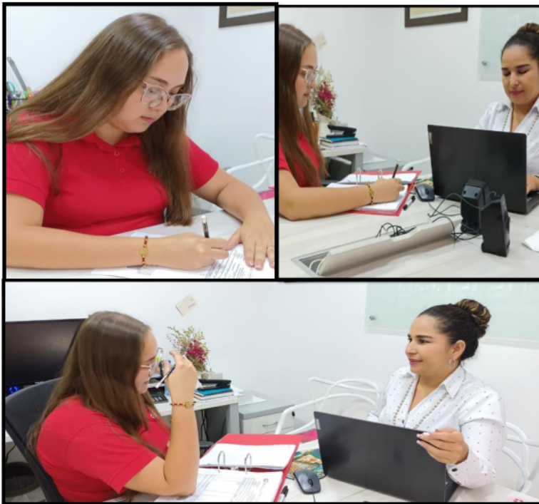
Figura 5. Evidencias de la entrevista

5.1.4. Se escuchó activamente las respuestas del entrevistado, se hicieron las preguntas específicas, se hicieron aclaraciones en ciertos puntos para facilitar la comprensión de la pregunta, se evitó cualquier tipo de distracción la entrevistada, lo que facilitó dar respuestas de manera adecuada.