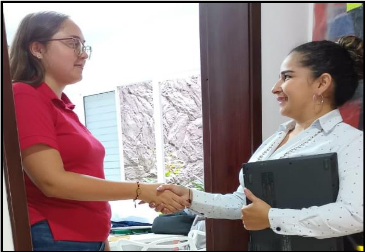
Figura 5. Evidencia de momento de despedida

5.1.5. Se tuvo en cuenta los límites de tiempo para el desarrollo de la actividad según el espacio dado por la persona entrevistada.