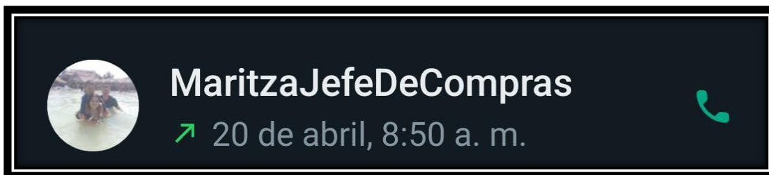
Figura 2. Evidencia de recordatorio para la entrevista

El día anterior se realizó una llamada para recordarle de la cita para la realización de la entrevista.