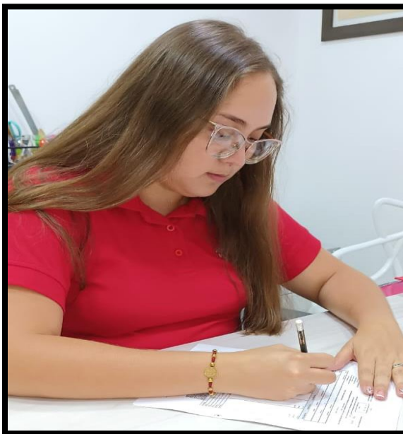
Figura 4. Evidencia de la entrevista

5.1.4. Se escuchó activamente las respuestas del entrevistado, se hicieron las preguntas específicas, se hicieron aclaraciones en ciertos puntos para facilitar la comprensión de la pregunta, se evitó cualquier tipo de distracción la entrevistada, lo que facilito dar respuestas de manera adecuada.