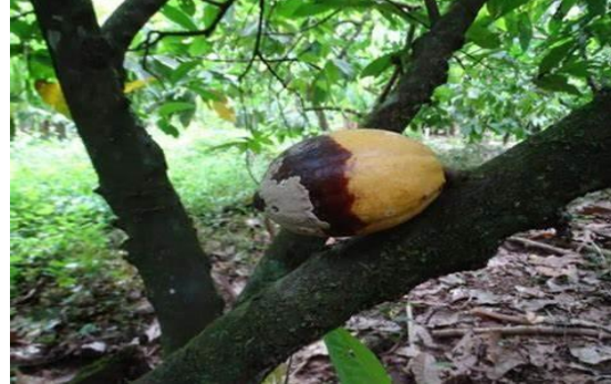
Ilustración 6 : mazorca negra