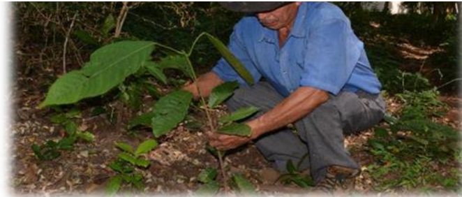
Ilustración 1: Siembra de cacao