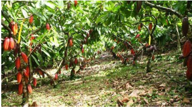
Ilustración 2 : cultivo de cacao