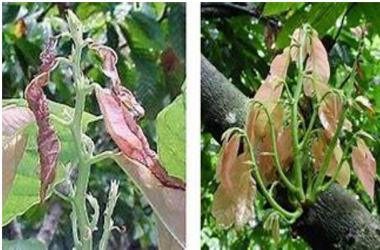
Ilustración 7: mal de machete