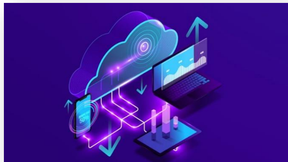
Ilustración 9 : datos en nube