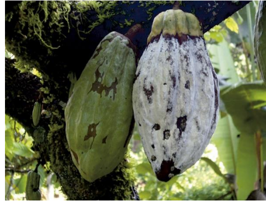
Ilustración 4 :monilia