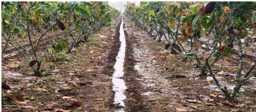
Ilustración 3 : riego del cacao