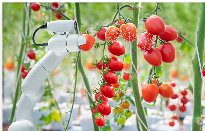
Ilustración 13 : robótica y sistemas autonomos

Sin embargo, los robots no pueden cosechar todos los cultivos. Los cultivos ideales para la recolección mecánica son los resistentes a los daños (como las almendras) o aquellos en los que las marcas pueden no ser importantes, como los tomates para salsa. Sin embargo, como los supermercados exigen tanto de la fruta fresca, se necesitan robots agrícolas más avanzados para recoger los cultivos que deben manipularse con más cuidado (SLATER, 2021).