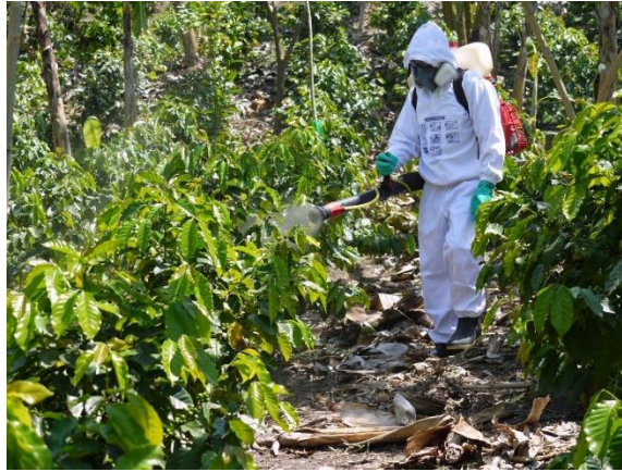
Ilustración 14 : fumigación