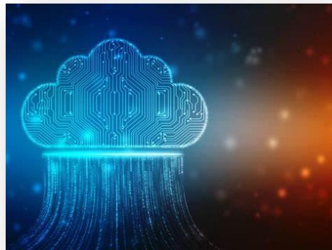
Ilustración 10 : big data

recursos, así como optimizar su uso de forma automática y proactiva, previendo eventos futuros. Favorece a la empresa dedicada al cacao puesto que toda la información recolectada durante los días, semanas, meses y años estará archivada en orden para que cuando sea requerida por algún trabajador podrá ser encontrada.” (Rayo, 2018)