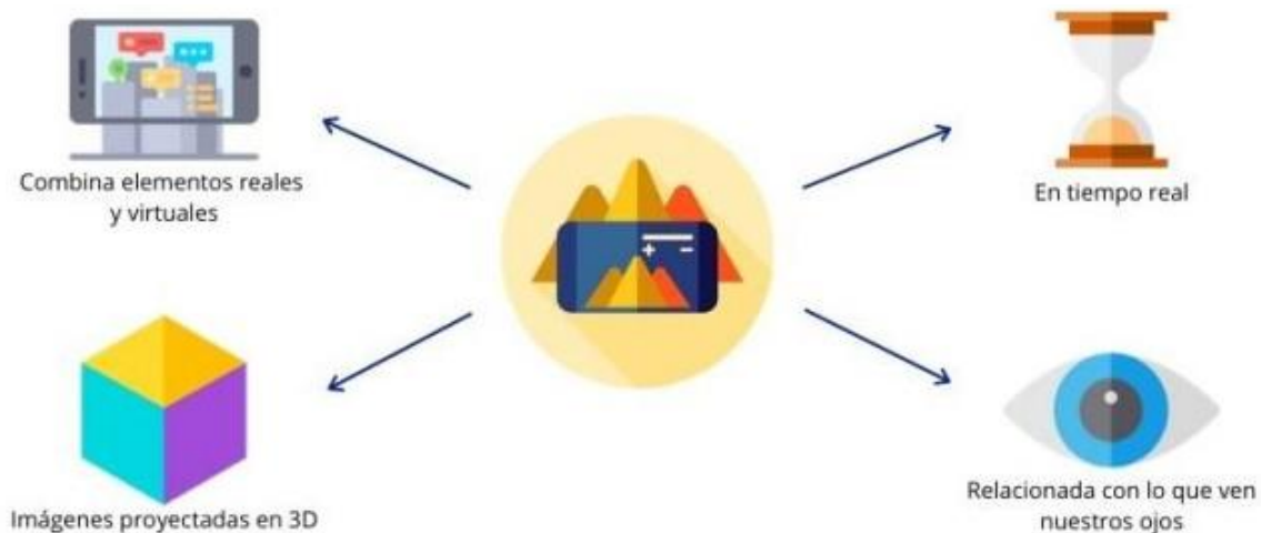
Ilustración 15 : funciones de la realidad aumentada