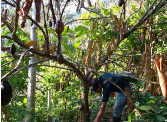
Ilustración 5 : escoba de bruja

A continuación, se muestra la forma gráfica de cómo se presentan estas enfermedades en el cultivo: