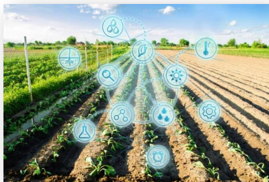
Ilustración 11 : retrato artificial

brindara rápidamente así sea requerida por diferentes dispositivos en un mismo tiempo.” (PEIRO, 2022)