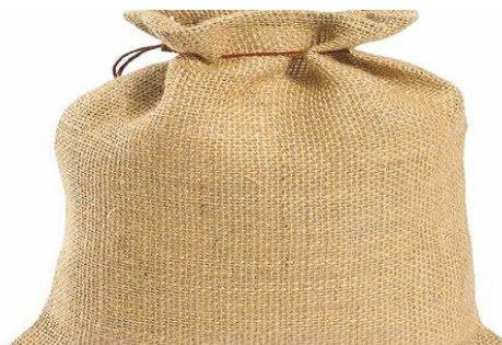
Ilustración 8 : saco de yute

“El cacao debe almacenarse hasta que esté listo para ser entregado. Antes de ser almacenado el cacao pasa por un periodo de secado a sol, esto con el fin de que las semillas que se encuentran dentro de la “maceta” pierdan la humedad y puedan ser trituradas posteriormente en fábricas. En estos lugares deben utilizarse sacos de yute estos son Los únicos sacos que deben utilizarse para el cacao, para su almacenamiento y transporte (Figura 8), ya que de lo contrario se detiene el proceso de cultivo del cacao.” (OCDIM, 20220)