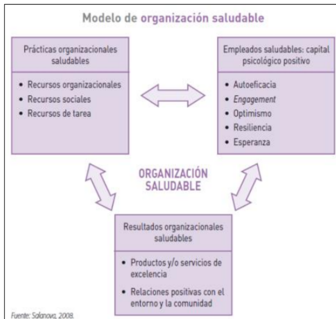
Modelo heurístico de organización saludable de Salanova (2008)