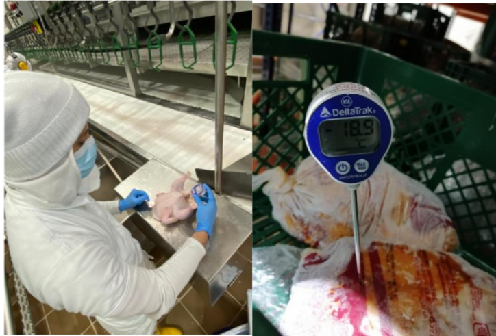
Figura 2. Toma de temperatura del pollo