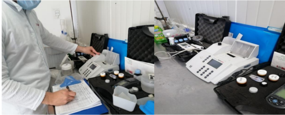
Figura 5. Espectrofotómetro y peachimetro (PH