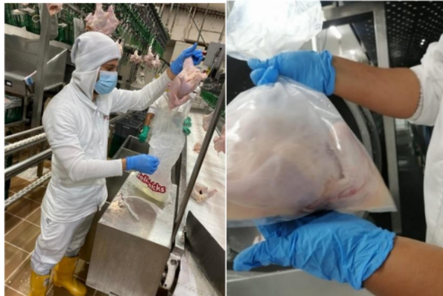
Figura 4. Realización de enjuagues