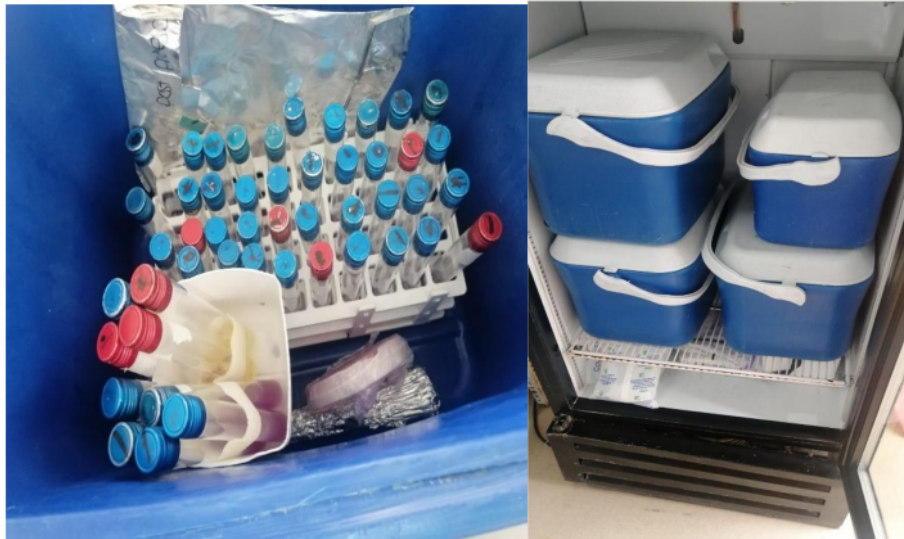
Figura 1. Tubos para la toma de muestras