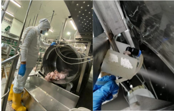
Figura 3. Dosificación de spectrum a la salida del escurridor